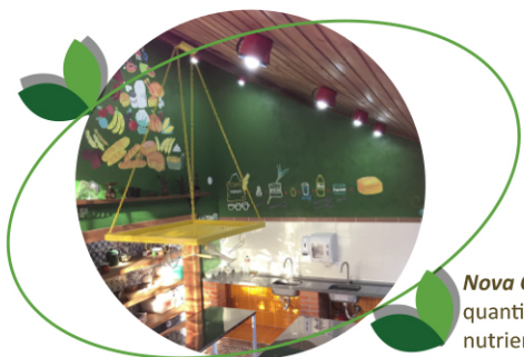
Nova Cozinha Experimental: quantificação de calorias, nutrientes e dos ingredientes