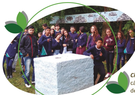
Ciclos da Água: cálculos de consumo de água em m^3